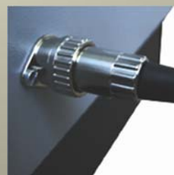
ロックコネクター