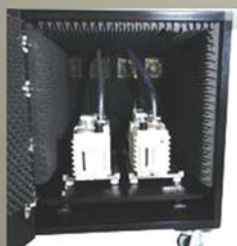
防音ポンプ格納庫