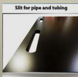
チューブ類 保持用スリット