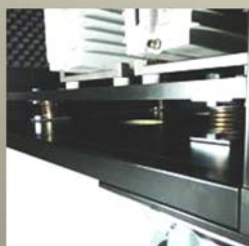
振動を99%カットする免震構造