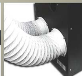
排気設備への接続 (オプション)