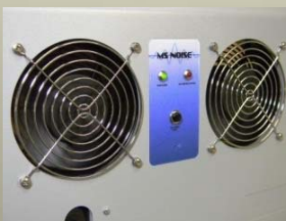
温度センサー&長寿命冷却ファン (480m 3 /hour)