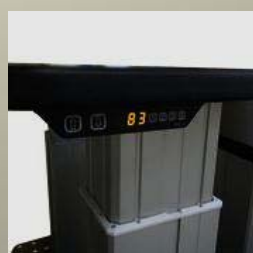
高さ表示 ディスプレイ