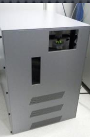
ウォーターチラー用エンクロージャー