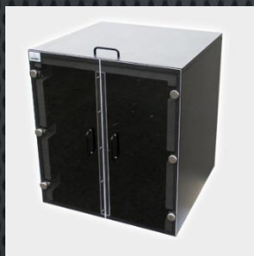
超音波洗浄機用エンクロージャー