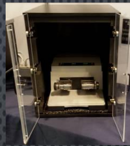
防音効果を実感できるユーチューブ動画が https://www.youtube.com/watch?v=Bb9sEZKfHiv